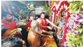
श्री नागचंद्रेश्वर मंदिर में 1 घंटे में दर्शन का दावा

प्राचीनकाल से पंचांग तिथि अनुसार सावन महीने के शुक्ल पक्ष की पंचमी के दिन ही इस मंदिर के पट खुलने को पारंपर है। श्री नागचंद्रेश्वर भगवान को यह मानना है। श्री राजगढ़ी की है। इस प्रतिमा में पूजन करार नाग के अडारन पर शिव जी के साथ देवी पार्वती कीटी