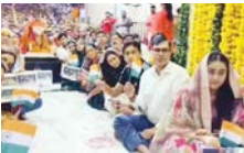
पूजा होने के बाद विष्णु लैंडर को साँपट लैंडिंग के लिए प्रार्थना की गई। इसमें कर्मांडू जी. एस. सोमनथन भी 24 मई को उज्जैन आए थे। उन्होंने महाकालेश्वर मंदिर में चंद्रयान-3 की लैंडिंग के लिए प्रार्थना की थी।

उज्जैन। चंद्रयान-3 की लॉन्चिंग के लिए उज्जैन में 14 जुलाई को अनुष्ठान-अभिषेक किया गया था। अब करीब 40 दिन बाद अभी सप्ताह पर चंद्रयान की लैंडिंग होने जा रही है। देश भर के लोग चंद्रयान की साँपट लैंडिंग के लिए प्रार्थना कर रहे हैं। इसके लिए उज्जैन के महाकालेश्वर मंदिर में भक्त आरती के दौरान विशेष पूजन अर्चन किया गया।