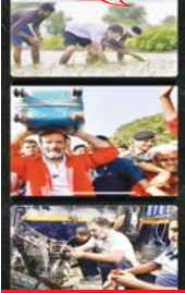
राजनीति की मूठी 'राजाबाबू' के दृश्य में अलग अलग लुक में नजर आये कुशल अभिनेता !

भक्तों के संकटों को हलने वाले नूनी विंतामन गणेश दूसरे नामों से भी पुकारे जाते है। इस मंदिर को अब लोग विट्टी वाले गणेश वा मोबाइल गणेश के नाम से जानने लगे है। देवा इंदौर है कि गणेश के भक्त इंदौर को नहीं देते और विदेशों में भी है। बाहर से बाहर रहने वाले भक्त अक्सर अपने शिरोधार्य को दर्शन कराते है और पुजारी उल्टक उनको गणेश के दर्शन कराते है। इसके साथ ही वे समय-समय पर खावा को खात कराते हुए अपनी विंता मोबाइल पर बताते है और जब उनकी समस्या का निराकरण हो जाता है तो वे तब भी खावा को भयवादा स्वरूप एक लैटर भेजाते है। पुजारी के अनुसार दुर्गा, नेत्रा, ज्वनी, जवान जैसे कई देवों से भक्तों के फोन आते है और विट्टियों वाले पहुंचते है। देवा और विदेशों में रहने वाले कई भक्त तो उनके परिचितों को फोन कराते है और हम उनकी बात गणेश से करा देते है साथ ही जब उन्हें मुमुद मंगनी होती है तो हम फोन को गणेश के पास रख देते है और वे भगवान से अपनी माता कह देते हैं जिसके जरिए जो अपने दिल की बात भगवान तक पहुंचते है।