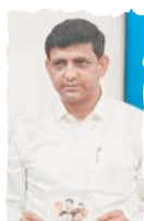
भाजपा महासचिव श्री कैलाश जी विजयवर्गीय