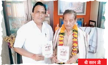
श्री सतन जी