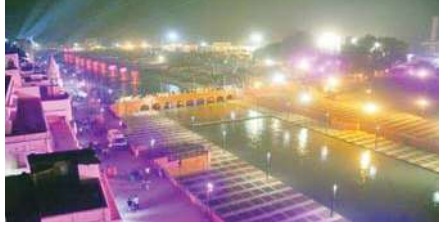
उनकी अगुवानी करेंगे। इसके बाद सीएम योगी वशिष्ठ की भूमिका में श्रीराम का राजतिलक करेंगे। इस आयोजन का साक्षी बनने के

विश्व रिकॉर्ड भी साबित होगा। इस रिकॉर्ड को हासिल करने के लिए 3 लाख 60 हजार दिये अतिरिक्त भी जलाए जाएंगे ताकि दीपमाला अनवरत रहे। शनिवार को शाम होते ही जैसे ही रामलला के दरबार में पहला दीप जलेगा, पूरी अयोध्या जगमग हो उठेगी। भगवान श्रीराम पुष्पक विमान रूपी हेलीकॉप्टर से अयोध्या पधरेंगे। सीएम योगी व राज्यपाल आनंदी बेन पटेल