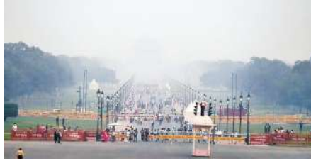
रहा है। ठंडी हवाओं के कारण आने वाले दिनों में भी स्तर रात का तापमान घटेगा, जिससे बढ़ने का अनुमान है। भारतीय

केंद्रीय प्रदूषण नियंत्रण बोर्ड (सीपीसीबी) के अनुसार, दिल्ली भर में वायु गुणवत्ता 'गंभीर' श्रेणी में बनी हुई है। आनंद बिहार में एक्यूआई 430, आरके पुरम में 417, पंजाबी बाग में 423 और जहांगीरपुरी में 428 रहा। विशेषज्ञों का कहना है कि उत्तर-पश्चिमी दिशाओं से चल रही ठंडी हवा के कारण प्रदूषित कण वातावरण में फैल नहीं पा रहे, जिस कारण प्रदूषण का स्तर लगातार बढ़