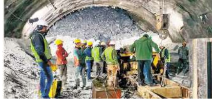
ना करना पड़े बल्कि उन्हें पहिए वाले स्ट्रेचर से खींचकर निकल जाए. सिल्वक्यारा सुरंग स्थल पर 'ऑक्सीजन सिलेंडर, मास्क, स्ट्रेचर से लेकर बीपी उपकरण तक' सभी चिकित्सा सहायता

हो गई. ऑपरेशन के बिट को ठीक करने के लिए हेलिकॉप्टर से मशीन लाई गई. ऐसे में जब रेस्क्यू ऑपरेशन अब अपने अंतिम चरण में है और इसी के मद्देनजर एम्बुलेंस भी तैयार रखी गई हैं और एनडीआरएफ की टीम भी मौके पर मौजूद है. रेस्क्यू ऑपरेशन के लिए एनडीआरएफ अतिरिक्त स्ट्रेचर तैयार कर रखी है जिसमें बेरिंग और पहिया लगाए जा रहे हैं ताकि मजदूरों को लंबी पाहण में क़ल