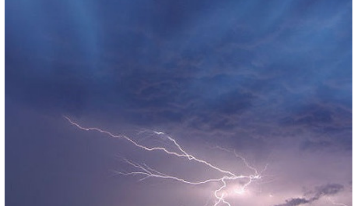
दिसंबर के पहले सप्ताह में तेज सर्दियाँ नहीं