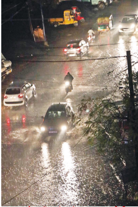
स्वर्गोन में 3 इंच से ज्यादा पानी गिरा