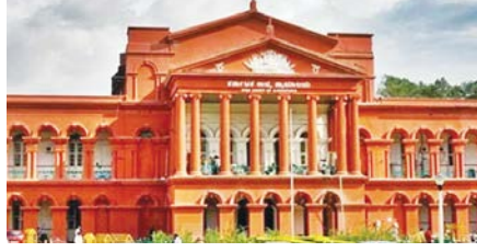
पेशानियां आने के बाद पत्नी ने कानूनी कार्रवाई की शुरुआत की थी। यहां कोर्ट ने 10 हजार रुपये का गुजारा भत्ता और बेटी के लिए

के दौरान मिल गया। अदालत का कहना है कि पत्नी सिर्फ शादी का हवाला देकर अपने जीवनसाथी के आधार कार्ड की जानकारी एकतरफा हासिल नहीं कर सकती है। दरअसल, हुबली की एक महिला ने एक पारिवारिक अदालत का दरवाजा खटखटाकर पति से गुजारा भत्ता मांगा था। दोनों की शादी नवंबर 2005 में हुई थी और उनकी एक बेटी भी है। रिश्ते में