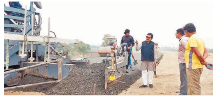
व्यापार के लिए फायदेमंद

कोटा, इंदौर, खंडवा, बुरहानपुर, इच्छापुर, अकोला से हैदराबाद जुड़ जाएगा। इस सड़क का दौरा इंदौर के सांसद शंकर लालवानी ने किया। उन्होंने कहा कि बुरहानपुर से अकोला तक