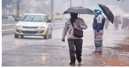
है, जबकि अधिकतम तापमान 24 डिग्री सेल्सियस रहेगा। समीर एप के मुताबिक दिल्ली में AQI लेवल गुरुवार को सुबह 8 बजे

इसके चलते तापमान भी थोड़ा और कम हो सकता है। दिल्ली में गुरुवार को न्यूनतम तापमान 13 डिग्री सेल्सियस रह सकता