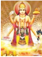
अनवरकल्य रस्तुयें कदयि नहीं खरीदनी चाहिए।

भजनकरवीर यानी कि धनतेरस इस साल बहुत से शुभ हस्त नक्षत्र में मनाई जायेगी। हस्त नक्षत्र के स्वामी आदि शक्र चंद्रमा हैं। मिलावा इस साल की भजनकरवीर आर्थिक और राजनीतिक उल्लेख-पुनर्न, बेचने, खरीदने-खरीदना, करण, उखा, जेम, दान, और कल को अपने अंदर रखेंगे होगी। 10 नवंबर को दिन के 12 बजकर 35 मिनट तक खरीदी रखेंगे और उसके पचास दिन स्थिर भूख होगी। 10 नवंबर को को पूरे दिन हस्तनक्षत्र होगा। राम के 5 बजकर 2 मिनट तक विपक्ष योग और उसके बाद भूषी योग लागेगा। उषा तिथि 11 नवंबर को है पर धन खरीदारी का मन 10 नवंबर को ही होगा। हस्त नक्षत्र में लक्ष्मी-गुरु का पुजन, जहाँ आर्थिक निवारण पर अजीब असर डालेगा, यहाँ नक्षत्रिण्य में विचित्र आर्थिक और राजनीतिक परिस्थितियों का साथी बनएगा।