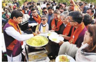
बीजेपी राष्ट्रीय महासचिव कैलाश किजयकव्जि ने इंदौर और दुनिया से जुड़े विभिन्न विषयों पर उनसे संबद्ध किया। पार्टी में सभी एनआरआई