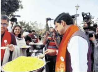
28 देशों के साथ दुबई, अबु धाबी, सिंगापो, सेन फ्रांसिस्को, जपान,