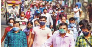
जिसके बाद केरल सरकार ने राज्य भर में स्वास्थ्य को लेकर अलर्ट

देश में कोरोना के मामले फिर से बढ़ने शुरू हो गए हैं। हाल ही में केरल में कोरोना के सबसे नए वैरिएंट जेन-1 की पुष्टि हुई थी।