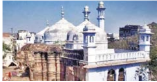
अदालत में मुकदमे को कार्यवाही में तेजी लानी चाहिए। छह महीने के भीतर इसे समाप्त किया जाना चाहिए। कोई भी अंतिम

मुताबिक ज्ञानवापी मस्जिद मंदिर की एक हिस्सा है। अदालत ने कहा कि यह मुस्लिमों का धार्मिक पूजा स्थल अधिकार है, 1991 द्वारा वर्जित नहीं है। यह निर्णय पवित्र स्थल के आसपास चल रही कानूनी लड़ाई के लिए पर्याप्त निहितार्थ रखता है। अदालत ने भागे आदेश दिया कि मामलों को तत्कालिकता को रोकना करने हुए, निचली