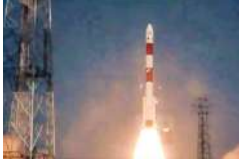
के बाद यह प्रक्षेपण किया जा रहा है। इस मिशन का जीवनकाल करीब पांच वर्ष का होगा। ध्रुवीय उग्रराह

नई दिल्ली, (एजेंसी) ISRO यानी भारतीय अंतरिक्ष अनुसंधान संगठन ने 2024 की धूमकेदार शुरुआत कर दी है। मंगल एजेंसी ने पहले ही दिन सोमवार को एक्स-रे पोलीमीटर स्पेक्ट्रासॉप्ट (XPoSat) सफलतापूर्वक लॉन्च कर दिया है। ऐतिहासिक चंद्रयान-3 को तरह इस लॉन्चिंग का गवाह भी आंध्र प्रदेश का श्रीहरिकोटा बना। ब्लैक होलस की स्टडी के मामले में यह उपलब्धि खासिल करने वाला भारत दुनिया का दूसरा देश बन गया है।