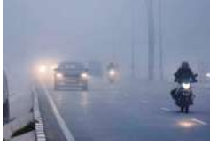
लुधका 14.4 डिग्री सेल्सियस पर आया गया जबकि रात का पार 7 डिग्री सेल्सियस रिकार्ड किया गया। यह

वहीं, कानपुर में मंगलवार को दिन में बर्फनीली हवाओं का चक्र और रात में शीत लहर से उंडक लगाकर बढ़ती जा रही है। मंगलवार को दिन का पार तीन डिग्री