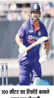
100 नीटर का रिकॉर्ड बनाने वाला पूरा में नही