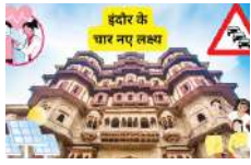
और बीमार न पड़ें।

● डिटिविज युप रिपोर्ट इंदौर। इंदौर कतीनेस्ट सिटी ने लगातार सात बार स्वच्छता में नंबर वन आकर यह साबित कर दिया है कि इंदौरियों का जच्चा सबसे भारी है। वह अगर दान लें तो कुछ भी कर सकते हैं। इंदौर के लोगों ने स्वच्छता के बाद बेहतर स्वास्थ्य, सौलर, ट्रेफिक और डिजिटल सिटी को अपना अगला लक्ष्य बना लिया है। प्रशासन, जगप्रतिनिधि, संस्थाएं और तमाम संगठन इस दिशा में अब मिल जुलकर प्रयास कर रहे हैं।