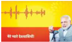
आत्मविश्वास भंग्य राम मंदिर के रूप में हमारी फजान बनकर सके सामने है। सोने पर सुहावा ये है कि आज मात जीजाबाई जी को जन्म जयंती है, जिन्होंने छत्रपति

नई दिल्ली, (एजेंसी) राम मंदिर के प्राण प्रतिष्ठा कार्यक्रम के लिए प्रधानमंत्री नरेंद्र मोदी ने शुक्रवार को सोशल मीडिया पर विशेष संदेश जारी किया। इस संदेश में पीएम मोदी ने अपनी मां को भी याद किया। मां का जिक्र कर पीएम मोदी भावुक हो गए। साथ ही पीएम मोदी ने ये भी बताया कि वह राम मंदिर की प्राण प्रतिष्ठा के लिए आज से 11 दिन का विशेष अनुष्ठान शुरू करने जा रहे हैं। प्रधानमंत्री ने बताया कि वह अपने अनुष्ठान का आरंभ नासिक प्राण पंचवटी से कर रहे हैं।