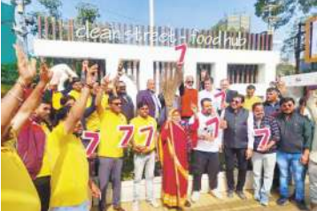
केप्ट टू आर्ट की वजह से इंदौर इस बार रस में आगे था, लेकिन इस बार इंदौर के अंकों में सिर्फ 200 पाठ्य का

● डिटिविज युप रिपोर्ट इंदौर। इंदौर ने फिर एक बार स्वच्छता का सातवां आसमान छू लिया है। इसकी घोषणा गई दिल्ली में आयोजित समारोह में।