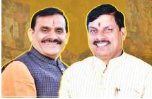
शेखर में माय 1.13% की ही बढ़ोतरी हुई थी। • नाथ परिवार के सामने आदिवासी बंधन हो सकता है उम्मीदवार सूत्रों की मानें तो छिंदवाड़ा लोकसभा सीट पर बीजेपी किसी आदिवासी नेता को उम्मीदवार बना सकती है। इस सीट पर मंडला सांसद और केंद्रीय मंत्री फगन सिंह कुलसे भी प्रत्याशी बनाए जा सकते हैं। कुलसे हाल