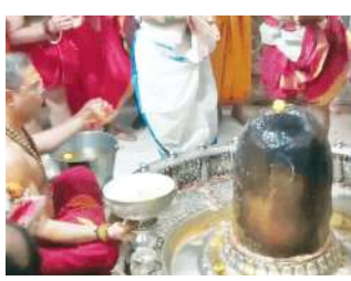
कर रहे हैं। आग संक्रांति का पुण्य का भारतीय ज्योतिष शास्त्र के सिद्धांत के अनुसार जब संक्रांति का क्रम सत्यन अथवा रात्रि या

@ डिटिविटव ग्रुप रिपोर्ट उज्जैन। नर्मदा पुरा म में प्रभू संक्रांति पर उज्जैन के श्री महाकालेश्वर मंदिर में महाकाल को तिल से बना उषटन लगाकर मां जल से स्नान कराया गया। स्नान-ध्यान के बाद भगवान का धाग, सूखे भांसे से श्रृंगार कर नग करण और आभूषण धारण कराए। तिल से बने पकवानों का भाग लगाकर आरती की। सोमवार तड़के 3 बजे पाप मास के शुक्ल पक्ष की चतुर्थी तिथि के परचात का धनु राशि को छोड़कर मकर राशि में प्रवेश हुआ, इसलिए मकर संक्रांति का अंत माना गया जा रहा है। संक्रांति पर बड़ी संख्या में श्रद्धालु शिप्रा नदी में स्नान करने पहुंच रहे हैं। नर्मदापुर, जवाहरपुर में भी नर्मदा के घाटों पर लोग स्नान - ध्यान के बाद दान पुण्य