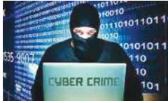
संपर्क किया था. अधिकारी ने शिकायत का हवाला देते हुए कहा, 'तब से वह (बुजुर्ग) निरन्तर रूप से उनके साथ (ठगी) बातचीत करते थे, ठगी ने बुजुर्ग को कई

अधिकारी ने बताया कि कोरपोरेटों में रहने वाले 66 वर्षीय बुजुर्ग ने अपनी शिफारश में पुलिस को बताया कि फंडित धोखेबाजों ने पहली बार नवंबर 2023 में उनसे