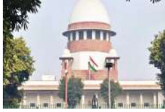
2004 के सुप्रीम कोर्ट के इस फैसले की वजहता की समीक्षा करेगा, जिसमें कहा गया था कि राज्यों के पास

नई दिल्ली, (एजेंसी) सुप्रीम कोर्ट ने मंगलवार को कहा कि पिछड़ी जातियों में जो लोग आरक्षण के हकदार थे और इससे लाभान्वित भी हो चुके हैं, उन्हें अब आरक्षित कैटेगरी से बाहर निकलना चाहिए। साथ ही यह भी कहा कि उन्हें अधिक पिछड़ों के लिए रास्ता बनाना चाहिए। सुप्रीम कोर्ट के 7 जजों की संविधान पीठ ने मंगलवार को 'इस कानूनी सवाल की समीक्षा शुरू कर दी कि क्या राज्य सरकार को शैक्षणिक संस्थानों में प्रवेश और सरकारी नौकरियों में आरक्षण देने के लिए अनुसूचित जातियों और अनुसूचित जनजातियों में उप-वर्गीकरण करने का अधिकार है?'