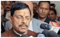
विकास की सारी बातें कर रहा हूँ। राममंदिर का न्योता टुकटारण पर जवाब दें राहुल गांधी

हरम सब जानते हैं कि परामर्शा की दया से, कई जर्मों के पुण्य के बाद हमको अछे अधिकार सौंप द्यकित्व का मौका दिया है, और आप तो कई मामलों में भाग्यशाली हो। एक बात अधिकांश बने हैं अगर सही चलो तो, जिंदगी भर रहे। इस लोको को तो हर 5 साल में परीक्षा देनी पड़ती है। आज मैं आपको ज्ञान-