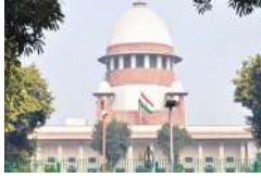
को बैठता का मामला लिखित है। इस कानून को लेकर विवाद इसलिए हुआ था क्योंकि मुख्य चुनाव आयुक्त

नई दिल्ली, (एजेंसी) चुनाव आयोग में दो आइएनटी की नियुक्ति का मामला सुप्रीम कोर्ट पहुंच गया है। अरुण गोगल के इस्तीफे के बाद खबर थी कि इसी सप्ताह केन्द्र सरकार को आइएनटी की नियुक्ति कर सकती है। अब कांग्रेस नेता ने सुप्रीम कोर्ट में अर्जी दी है कि 2023 के फरवरी को देखें हुए केन्द्र सरकार को आइएनटी की नियुक्ति प्रक्रिया से रोक दिया जाए। बता दें कि फरवरी में अरुण चंडा भी चुनाव आयोग के परदे रिटायर हो गए थे। ऐसे में इस समय चुनाव आयोग के फैसले में केवल एक ही आइएनटी है और वह है मुख्य चुनाव आयुक्त राजीव कुमार।