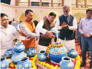
निकाली जा रही है जहां से यह नदियां और इनके प्रोजेक्ट जुड़ेंगे। आज से 14 मार्च तक तीन दिवसीय कार्यक्रम इसके लिए तय किए गए हैं। इसमें जल कलश