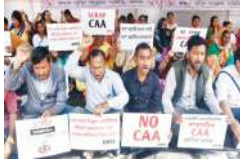
जान चली गई थी। असम में विपक्षी दलों ने सोमवार को सीएए लागू

नई दिल्ली, (एजेंसी) भारत में सीएए यानी नागरिकता (संशोधन) अधिनियम-2019 लागू हो चुका है। केन्द्र की नरेंद्र मोदी सरकार ने लोकसभा चुनाव से ठीक पहले सोमवार को सीएए को लागू करने की घोषणा की। विभाज्यसद कानून को पारित किए जाने के चार साल बाद केंद्र के इस कदम के कारण पाकिस्तान, बांग्लादेश और अफगानिस्तान से 31 दिसंबर, 2014 से पहले भारत आने वाले गैर-पुलिस प्रवासियों को नागरिकता प्रदान करने का रस्ता साफ हो गया है। हालांकि कानून के लागू होते ही देश के कई हिस्सों में विरोध प्रदर्शन शुरू हो रहे हैं। बता दें कि इसके पहले सीएए विरोधी प्रदर्शनों या पुलिस कार्रवाई के दौरान 100 से अधिक लोगों की