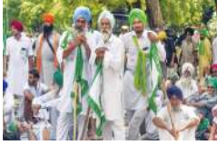
पल्लत करों! एसकेएम ने कहा कि महापंचायत में मोदी सरकार को

नई दिल्ली, (एजेंसी) दिल्ली के रामलीला मैदान में 14 मार्च को किसान मजदूर महापंचायत होने जा रही है। संयुक्त किसान मोर्चा (एसकेएम) का दावा है कि पंजाब-हरियाणा और यूपी सहित कई राज्यों के लोग इस महापंचायत में शामिल होंगे। एसकेएम ने मंगलवार को कहा कि दिल्ली पुलिस ने उसे 14 मार्च को रामलीला मैदान में 'महापंचायत' करने की इजाजत दे दी है। वहीं, दिल्ली पुलिस ने कहा कि उसने कड़ी शर्तों के साथ इजाजत दी है।