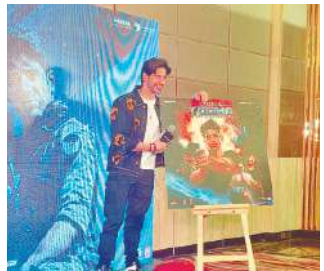
डिटेक्टिव गुरु रिपोर्ट

मो शमीजी ने आगे कहा कि जिस तरह सफ़र सलह के मामले में इंदौर देश में लगातार नंबर नन आ रहा है वैसी ही रिवाज मध्यस्तता से भी नंबर वन है। मो शमीजी ने आगे कहा कि आज तालुका से लेकर सुप्रीम कोर्ट तक लाखों केस पेंडिंग रहें हैं, ऐसे में मध्यस्तता केंद्र में दोनों मामलों के केस सुलह से अदालत में भार कम होगा।