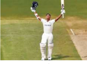
नाबाद 214 रन बनाए। फिफालह यशस्वी ICC वर्ल्ड टेस्ट चैंपियनशिप के मौजूदा साक्षरक में सबसे ज्यादा रन बनाने वाले खिलाड़ी हैं।