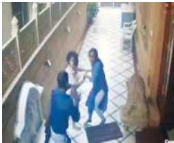
ने मिलकर हथियार से लैस बदमाश का विरोध किया। उसकी बंदूक भी छीन ली। हालांकि, वह भागने में सफल रहा।

हैदराबाद, (एजेंसी) हैदराबाद के बेगमपेट की मां-बेटी की बहादुरी की खूब चर्चा हो रही है। दोनों ने हिमत दिखाते हुए घर में घुसे हथियार बंद बदमाशों का डटकर सामना किया। इस दौरान उन्होंने उसकी बंदूक छीन ली और उसे खदेड़ दिया। उनकी यह बहादुरी सीटीवी कैमरे में कैद हो गई। यह वीडियो सोशल मीडिया में वायरल हो रहा है। मां-बेटी ने मिलकर हैदराबाद में बंदूक की नोक पर होने वाली डकैती के प्रयास को विफल कर दिया। इस घटना की खूब चर्चा हो रही है। मीडिया रिपोर्टों के मुताबिक, घर में मौजूद महिला को जैसे ही भनक लगी कि वह मदद के लिए चिल्लाते लगी। इसके बाद उसकी बेटी भी मदद के लिए बाहर निकली और दोनों