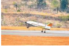
दौरान आरएलवी को वायुसेना के चित्रक हेलीकॉप्टर से करीब साढ़े बार किलोमीटर की ऊंचाई से छोड़ा गया। परीक्षण के दौरान आरएलवी ने सफलतापूर्वक रनवे पर

नई दिल्ली, (एजेंसी) इसरो की आज बड़ी सफलता मिली। दरअसल इसरो की रीयूजेबल लॉन्च व्हीकल तकनीक (लॉन्च व्हीकल को दोबारा इस्तेमाल करने की तकनीक) का परीक्षण सफल रहा है। कर्नाटक के चित्रदुर्ग स्थित एयरोनॉटिकल टेस्ट रेंज में शुक्रवार की सुबह करीब 7.10 बजे इसरो का रीयूजेबल लॉन्च व्हीकल पुष्पक सफलतापूर्वक ऑटोमैटिक तरीके से रनवे पर लैंड हुआ। रीयूजेबल लॉन्च व्हीकल की सफल लैंडिंग पर इसरो ने बयान जारी कर बताया कि रीयूजेबल लॉन्च व्हीकल तकनीक के मामले में इसरो ने बड़ी कामयाबी हासिल की है। इसरो इससे पहले भी दो बार रीयूजेबल लॉन्च व्हीकल की सफल लैंडिंग करा चुका है। बीते साल इसरो ने रीयूजेबल लॉन्च व्हीकल के परीक्षण के