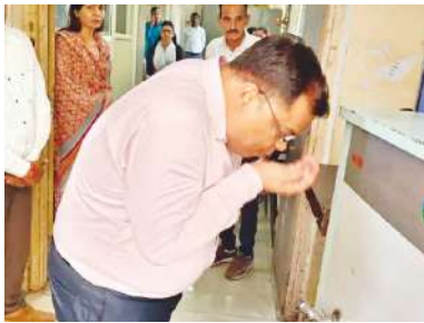
निगम मुख्यालय स्थित राजस्व विभाग का निरीक्षण किया। राजस्व विभाग में कर्तव्यों को पूर्ण करने के लिए अन्य

डिटेक्टिव ग्रुप रिपोर्ट इंदौर। नगर निगम कमिश्नर शिवम वर्मा ने मंगलाचरण को निगम मुख्यालय स्थित जन्म-मृत्यु, विवाह पंजीयन और शहरी गरीबी उपशामन प्रकोष्ठ विभाग का निरीक्षण किया। कमिश्नर ने शहरी गरीबी उपशामन प्रकोष्ठ विभाग भी निरीक्षण किया गया। निरीक्षण के दौरान विभाग के स्टाफ से शासन की जनकल्याणकारी योजनाओं के संबंध में जानकारी लते हुए, कार्य को समय सीमा में पूर्ण करने के निर्देश दिए गए। कमिश्नर द्वारा विभाग के निरीक्षण के दौरान विभाग में लगे ड्रिफ्टिंग वाटर कूलर का पानी पीया। इसके साथ ही विभाग में आने वाले नागरिकों के लिए बेंचिंग रूम की व्यवस्था करने, सुविधा घर में आसानी लाने व पार्किंग लाइटें लगाने के निर्देश दिए गए।