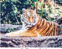
डिटेक्टिव ग्रुप रिपोर्ट

नहीं घुम सकेंगे टूरिस्ट, बफर जोन में घुमने का है मौका