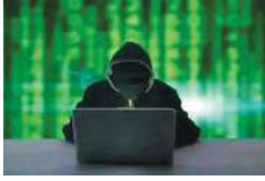
देी है। कोतवाली पुलिस के मुताबिक गगर की एक महिला का कहना है कि दिसंबर 2023 में उनके मोबाइल नंबर

अल्मोड़ा, (एजेंसी) साइबर ठग लोगों को ठगने के लिए एक से एक नया तरीका निकाल रहे हैं। साइबर ठगों ने महिला से ठग कर 10 लाख रुपये उठा लिए। साइबर ठगों ने महिला को पार्ट टाइम जॉब का झंझा देकर लाखों रुपये की ठगी है। यह पूरा हेतान करने वाला अल्मोड़ा जिले में सामने आया है। पुलिस ने केस दर्ज जांच शुरू कर दी है। अल्मोड़ा के भागीदारों निवासी एक पट्टी-लिखी महिला को यूट्यूब शेयर चैनल पर पार्ट टाइम जॉब करना कहना पड़ गया। शांति साइबर ठग ने महिला को टास्क में कामए रुपये वापस देने का झंझा देकर करीब दस लाख रुपये उठा लिए। पीड़िता को शिकायत पर कोतवाली पुलिस ने मुकदमा दर्ज कर जांच शुरू कर