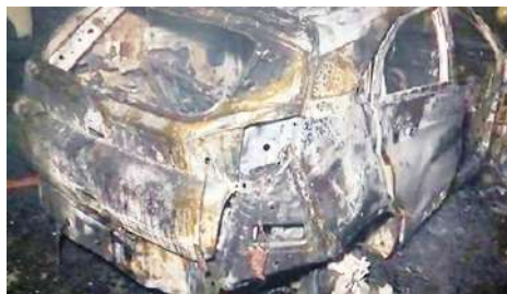
रात 1 बजकर 9 मिनट पर फायर कंट्रोल को सूचना मिली थी कि सांघी