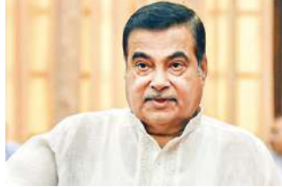
अच्छी सेवाएं नहीं दे पा रहे हैं तो आपको टोल चार्ज नहीं करना चाहिए...। हम यूजर फीस लेने और अपने हितों

सेटलाइट वेबड टोलिंग पर आयोजित वर्कशॉप में शामिल हुए गडकरी ने टोल टैक्स पर खुलकर बात की। मीडिया रिपोर्ट्स के अनुसार, उन्होंने कहा, 'अगर आप