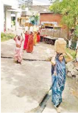
@ डिटैक्टिव ग्रुप रिपोर्ट श्री राम बारीड

देपालपुर। ग्राम पंचायत आगरा में पानी के लिए दर-दर भटक रहे लोग शासन की हर घर नल जल योजना को टेकेदार और सरपंच ने उड़ाया हवा में अब तक नल जल योजना के तहत गांव में नल नहीं हुए चालू सूत्रों से पता चला है की टेकेदार और सरपंच की आपसी खींचतान की वजह से ना