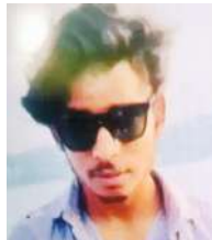
उठाया। तीनों ने शव को फंदा से उतारा और पास में स्थित जेपी अस्पताल पहुंचाया। जहां डॉक्टरों ने मौत की पुष्टि कर दी।

भोपाल। भोपाल में एक युवक ने प्रेमिका की शादी से एक दिन पहले सुसाइड कर लिया। उसका शव सोमवार सुबह घर के कमरे में फंदा पर लटका मिला। उसकी गलफ्रेंड की मंगलवार को शादी है। इसी बात को लेकर वह डिप्रेसन में था। युवक ने सुसाइड से पहले गलफ्रेंड को मैसेज किया। जिसमें उसने लिखा- एक मां से उसका बेटा छीनने के लिए धन्यवाद।