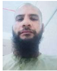
एनकाउंटर में मारे जाने का बदला लेने की नीयत से कर रहा था।

उसने एटीएस को बताया कि मोहल्ले के बच्चों का मजहबी कट्टरपंथ के नाम पर ब्रेनवाश करता था। कश्मीर और आतंकियों से जुड़े स्टेशन लिखकर नाबालिग बच्चों को पढ़ाता था। आरोपी के मोबाइल में आर्मी और पुलिस के कई बड़े अधिकारियों के फेमिली के फोटो मिले हैं। यह सब वह सिमी के आठ आतंकियों के