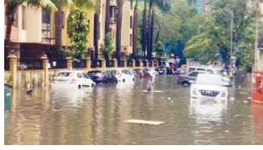
इसी अलर्ट के चलते मुंबई, ठाणे, पुणे, रत्नागिरी-सिंधुदुर्ग के साथ-साथ पनवेल के ग्रामीण हिस्सों में

भारी बारिश के कारण भारत की आर्थिक राजधानी मुंबई सोमवार को थम सी गई। यहां इस बारिश से जल्द राहत मिलने की कोई उम्मीद नहीं दिख रही है। दरअसल, भारतीय मौसम विज्ञान विभाग (आइएमडी) ने आज भी महाराष्ट्र की राजधानी के लिए रेड अलर्ट जारी किया है।