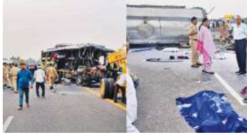
भीषण था कि डबल डेकर बस के परखच्चे उड़ गए। जहाँ हादसा हुआ, उस जगह लाशों का अंबार लग गया।

जानकारी के मुताबिक, डबल डेकर बस (UP95 T 4720) बिहार के मोतिहारी से दिल्ली आ रही थी। जब बस सुबह करीब 5.15 बजे उत्तरांचल के बेहटा मुजावर थाना क्षेत्र के गढ़ा गांव के सामने पहुंची तभी पीछे से तेज रफ्तार दूध से भरे टैंकर ने ओवरटेक किया और इसी दौरान बस से टक्कर हो गई। यह हादसा इतना