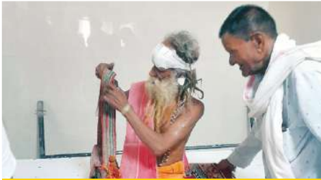
हाल ही में बदमाशों ने एक आश्रम को निशाना बनाकर महंत को घायल कर वारदात की थी।

DGR विशेष @ पृथ्वी पृथ इंदौर। सबसे अधिक चोरी, लूट की वारदातें पुलिस के लिए चुनौती बनती जा रही हैं। शहरी इलाकों की कालोनियों के साथ-साथ आउटर में बनी कालोनियों को भी बदमाश निशाना बना रहे हैं। वहीं हाल ही में दो मंदिरों में हुई एक जैसी वारदातों से यह शक है कि बरमूडा गैंग अब मंदिरों और आश्रमों को निशाना बना रही है। देखने में आया है कि शहर के आउटर में बनी कालोनियां बदमाशों के निशाने पर हैं। यहां लगातार डकैती और चोरी की कई बड़ी वारदातें सामने आई हैं। आउटर भी बनी कालोनियों में वारदात को अंजाम देने के बाद बदमाश यहीं से दूसरे शहर में भाग निकलते हैं। बदमाश अधिकतर बाहरी सीमा पर बनी टाउनशिप को आसानी से निशाना बनाते हैं।