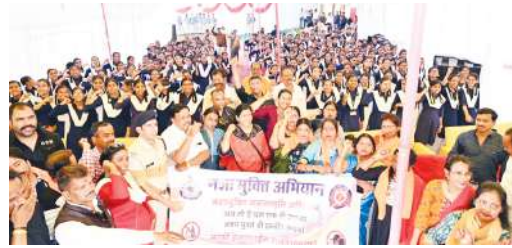
साथ नशामुक्ति की शपथ ली। इस दौरान उन्होंने इंदौर पुलिस द्वारा किए जा रहे सायबर अवेयरनेस, नशामुक्ति अभियान की प्रशंसा की। विधायक सुश्री उषा ठाकुर ने कहा कि बच्चों और युवाओं पर नशे का गलत असर पड़ता है। छोटी उम्र में ही नशा करने से शारीरिक विकास के साथ-साथ मानसिक विकास तक रुक जाता है। स्कूलों में ऐसा कई बार देखा गया है, इस वजह से छात्र पढ़ाई पर नहीं लागे पाते और अपने भविष्य के साथ खिलवाड़ करते हैं। विद्यार्थी जीवन में पढ़ाई खेल व देश भक्ति का अभाव