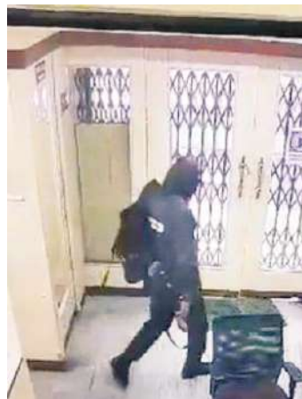
फुटेज के आधार पर पत्नी ने की शिनाख्त