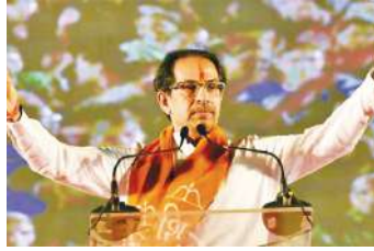
कि वो करीब 115 से 125 सीटों पर विधानसभा चुनाव लड़ने का टारगेट कर रही है. यह बात ऐसे समय में सामने

सूत्रों ने बताया कि शिवसेना (यूबीटी) इस साल के अंत में होने वाले विधानसभा चुनावों के लिए महा विकास अघाड़ी (एमवीए) गठबंधन के साथ चुनाव लड़ने के लिए तैयार है. हालांकि, उद्धव सेना ने साफ कर दिया