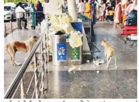
कमी पाई थी, जिसमें साफ-सफाई नहीं होना, यहां पर साफ-सफाई

यात्रियों के गंदगी पर टवीट के बाद इंदौर एयरपोर्ट प्रबंधन का एक्शन