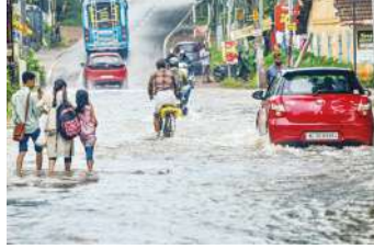
केरल में जगह-जगह हो रही बारिश से भारी तबाही देखने को मिल रही है। पलक्कड़ में एक स्कूल बस

नई दिल्ली, (एजेंसी) केरल में लंबे वक्त से बारिश का सिलसिला जारी है। 18 जुलाई यानी गुरुवार को भी यहां के कई हिस्सों, खासकर उत्तरी मालाबार जिलों के पहाड़ी इलाकों में भारी बारिश जारी रही। भयंकर बारिश से यहां सामान्य जनजीवन पूरी तरह अस्त-व्यस्त हो गया है। उत्तरी केरल के वायनाड, कन्नूर और कासरगोड जिलों के कई हिस्सों से बाढ़, पेड़ों के उखड़ने, संपत्ति को नुकसान और मामूली लैंडस्लाइड की घटनाएं सामने आईं। यहां आईएमडी ने एक दिन के लिए रेड अलर्ट जारी किया है। इसके साथ ही तीनों जिलों में जिला प्रशासन ने शुक्रवार, 19 जुलाई को स्कूल-कॉलेज में छुट्टी घोषित कर दी है।