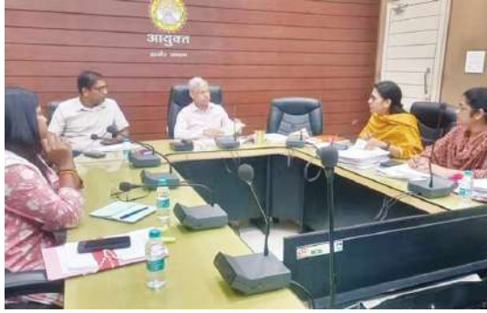
भिक्षुओं या किसी नाबालिग बच्चे को भीख स्वरूप कोई चीज प्रदान करता है या देता है या नाबालिग बच्चे से कोई सामान खरीदता है तो उसके विरुद्ध इस

जारी आदेश के अनुसार भिक्षुओं को भीख स्वरूप कुछ भी देना या नाबालिग बच्चों से किसी सामान को खरीदना इस आदेश से निषेध किया गया है। इसका उल्लंघन दण्डनीय होगा। जो व्यक्ति