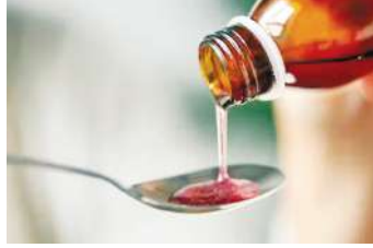
''नॉट ऑफ स्टैंडर्ड क्वालिटी'' की श्रेणी में रखा गया है। इकनामिक टाइम्स के मुताबिक स्वास्थ्य मंत्रालय

सेंट्रल ड्रग्स स्टैंडर्ड कंट्रोल ऑर्गनाइजेशन के मुताबिक ड्राइएथिलीन ग्लाइकोल और एथिलीन ग्लाइकोल पाए जाने की वजह से 100 कंपनियों के कफ सिरप को