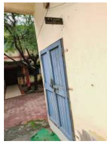
के कार्यालय में अधिकारियों एवं कर्मचारी अनुपस्थित पाए गए

वह सारी टैबले खाली पाई गई प्राथमिक विद्यालय क्रमांक एक में 10 20 तक ताला ही नहीं खुला अधिकारियों एवं कर्मचारियों द्वारा कहा तो खूब जाता है लेकिन हकीकत कुछ और नजर आ रही है लाखों रुपए का वेतन पाने वाले कर्मचारी व अधिकारी अपने कर्तव्यों के प्रति कितने समर्पित एवं निष्ठावान है इसी से पता चलता है जब अधिकारी ही कुर्सी से गायब मिले अधिकारीअपने अधीनस्थ कर्मचारियों पर किस तरह से आम जनता का काम किस तरह से होता