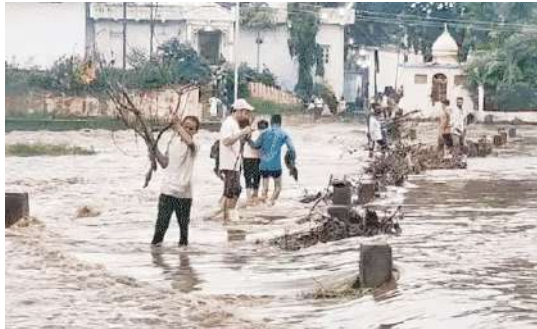
टीम उसकी तलाश कर रही है।

अशोकनगर के मुंगावली में मंगलवार सुबह 3 घंटे में 6 इंच पानी गिरा। स्कूल, मकान और दुकानों में पानी भर गया। नेशनल हाईवे-346 का पुल डूब गया। दोनों ओर 400 फीट तक पानी भर गया। उधर, सिवनी में एक युवक बाइक समेत नाले में बह गया। पुलिस और एसडीआरएफ की