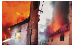
आग की लपटें दिख रही हैं। फैक्ट्री के ऊपर का पूरा आसमान काला हो गया है। वहीं दमकल की गाड़ियां आग बुझाने में जुटी हैं। आसपास का इलाका खाली करा दिया गया है। यह हादसा कैसे हुआ इस बारे में अभी कोई जानकारी सामने नहीं आई है।

खबर लिखने तक आग पर काबू नहीं पाया जा सका है। दिल्ली फायर सर्विस की 25 दमकल की गाड़ियां मौके पर भेजी गई हैं। इस घटना का एक वीडियो भी सामने आया है। फैक्ट्री से काले रंग के धुएं की गुबार निकल रही है। आसमान में