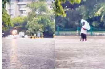
हालांकि, इस बारिश से थोड़ी परेशानी जरूर हो सकती है क्योंकि ऑफिस के टाइम में सुबह दफ्तर जाने

नई दिल्ली, (एजेंसी) दिल्ली-एनसीआर में आज (24 जुलाई) सुबह से ही जबरदस्त बारिश हो रही है। भारी बारिश की वजह से दिल्ली, नोएडा के कुछ इलाकों में जलभराव भी हुआ है। एक तरफ जहां बारिश ने उमस भरी गर्मी से राहत दी है तो वहीं, दूसरी ओर सड़कों पर पानी भरने से लोगों की परेशानी भी बढ़ रही है। दरअसल, जलभराव के बीच गाड़ियों की रफ्तार थमने से सुबह के वक्त दफ्तर जाने वालों को ट्रैफिक जाम से जूझना पड़ सकता है। मौसम विभाग की माने तो दिल्ली, नोएडा, गाजियाबाद, फरीदाबाद और आसपास के इलाकों में अगले कुछ घंटों में हल्की से मध्यम बारिश और बूंदबांदी का दौर जारी रहेगा।