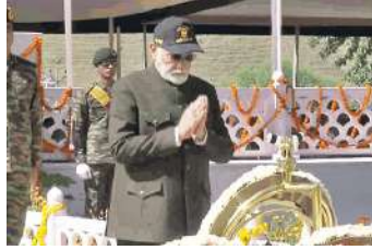
अपने संबोधन में पीएम मोदी ने कहा, 'आज लड़ाख की ये महान धरती कारगिल विजय के 25 वर्ष पूरे होने

श्रीनगर. देश 25वां कारगिल विजय दिवस मना रहा है. इस मौके पर कारगिल युद्ध स्मारक पहुंचे प्रधानमंत्री नरेंद्र मोदी ने द्रास में शहीदों को श्रद्धांजलि दी. उन्होंने 1999 में भारत-पाकिस्तान की जंग में अपने प्राणों की आहुति देने वाले बहादुर जवानों को याद किया. पीएम मोदी ने अपने संबोधन में कहा कि कारगिल में हमने सिर्फ युद्ध नहीं जीता था बल्कि सत्य, संयम और सामर्थ्य का अद्भुत परिचय दिया था. उन्होंने कहा कि भारत शांति के लिए प्रयास कर रहा था लेकिन पाकिस्तान ने अपना अविश्वासी चेहरा दिखाया था. पाकिस्तान ने अतीत में जितने भी दुष्प्रयास किए, उसे मुंह की खानी पड़ी लेकिन पाकिस्तान ने अपने इतिहास से कुछ नहीं सीखा है.