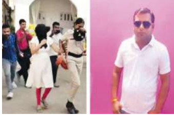
एफएसएल जांच में स्पष्ट हुआ कि हत्या के बाद घर में पसरे खून को पानी से धोया गया है। इसके बाद

मुजफ्फरपुर, (एजेंसी) बिहार के मुजफ्फरपुर से रूढ़ को कंपा देने वाली खबर आई है। जीजा से अपनी बहन के अवैध प्रेम संबंध का विरोध करने पर एक भाई को जान से हाथ धोना पड़ा। घटना कांटी थाना के अकुराहां गांव की है। युवक की अपनी ही बहन, बहनोई और बड़े भाई और भाभी ने मिलकर बेरहमी से रॉड से पीट-पीटकर हत्या की गई। घटना के बाद घर से खून साफ कर शव को श्मशान में ले जाकर जलाया गया। मृत युवक रिशेरा की पत्नी ने अपने मायके से आकर पति की हत्या की शिकायत थाने में दर्ज कराई। उसके बाद पुलिस मामले की जांच के लिए एफएसएल की टीम लेकर युवक के घर पहुंची।