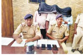
50 ग्राम रेडियोएक्टिव पदार्थ 'कैलिफोर्नियम' मिला। उनके पास से चार मोबाइल फोन भी बरामद किए गए हैं।

एजेंसी के अनुसार, गोपालगंज में पुलिस को मुखबिर से सूचना मिली थी, जिसके बाद कुचायकोट पुलिस स्टेशन एरिया में बलथरी इलाके से तीन लोगों को पकड़ा गया। पूछताछ कर उनकी तलाशी ली गई तो उनके पास