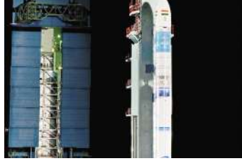
तीसरी और अंतिम उड़ान सफलतापूर्वक पूरी हो गई है। उन्होंने कहा कि रॉकेट ने अंतरिक्ष यान को ठीक उसी

नई दिल्ली, (एजेंसी) भारतीय अंतरिक्ष अनुसंधान संगठन (ISRO) ने आंध्र प्रदेश के श्रीहरिकोटा स्थित सतीश धवन अंतरिक्ष केंद्र से एसएसएलवी-डी3/ईओएस-08 मिशन का तीसरा और अंतिम रॉकेट को सफलतापूर्वक लॉन्च कर दिया। SSLV-D3 ने EOS-08 को कक्षा में सटीक रूप से स्थापित किया। इसरो के लिए यह बड़ी सफलता है। उपग्रह को सफलतापूर्वक लॉन्च करने के बाद अंतरिक्ष एजेंसी के प्रमुख एस सोमनाथ ने एसएसएलवी के विकास कार्य के पूरा होने की घोषणा की।