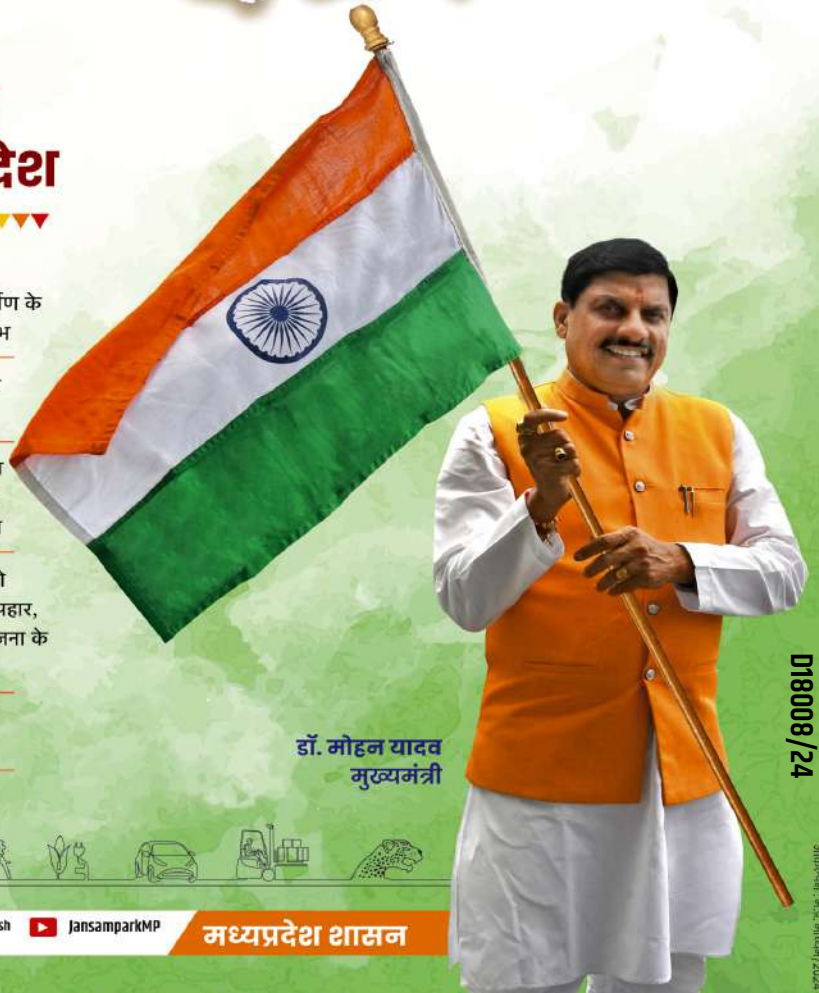
डॉ. मोहन यादव मुख्यमंत्री

मुख्यमंत्री किसान कल्याण योजना में 83 लाख से अधिक किसानों को ₹14254 करोड़ की सहायता