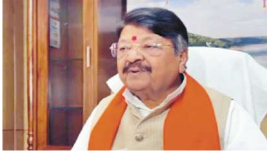
समाज को बचाने के लिए मुगलों के धर्म के त्योहार है, हमें हमारी सोच बदलना सामने संघर्ष किया। देश के त्योहार सभी होगी। दरअसल रविवार को विजयवर्गीय

हिंदू शब्द कैसे मजबूत हो इसके लिए हमें काम करना होगा। होली, दीपावली, राखी, भगवान परशुराम, महाराणा प्रताप हम सब के हैं। महाराणा प्रताप ने हिंदू