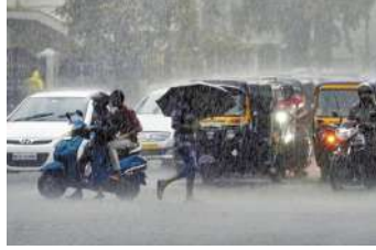
का ऑरेंज अलर्ट जारी किया, जबकि अन्य कई राज्यों के लिए यलो अलर्ट है। भारत मौसम विज्ञान विभाग ने कहा

नई दिल्ली, (एजेंसी) मानसूनी बारिश और उसके चलते भूस्खलन से पहाड़ी राज्यों की दुस्खारियां कम नहीं हो रही। सोमवार को हिमाचल प्रदेश में मणिमहेश से आ रहे श्रद्धालुओं का एक दल भूस्खलन की चपेट में आ गया, जिसमें एक श्रद्धालु की मौत हो गई। राज्य में जगह-जगह पहाड़ के टूट के गिरने से 100 से अधिक सड़कें बंद हैं। उत्तराखंड में भी कुछ ऐसा ही हाल है और भूस्खलन के चलते बदरीनाथ हाईवे पर वाहनों की आवाजाही करीब चार घंटे तक बाधित रही। मैदानी राज्यों में भी लोगों को जलभराव की समस्याओं का सामना करना पड़ रहा है। मौसम विभाग ने उत्तराखंड समेत पांच राज्यों और केंद्रशासित प्रदेश में मंगलवार के लिए बारिश