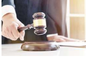
इस पर कर्नाटक हाई कोर्ट की जज ने कहा कि ऐसी मांग तो गैर-वाजिब है। फिर भी यदि इतना ही खर्च करने

बेंगलुरु, (एजेंसी) पति से अलग रहने वाली महिला ने गुजारे भत्ते के तौर पर हर महीने 6 लाख 16 हजार रुपये की मांग की। हाई कोर्ट में महिला के वकील ने यह मांग पत्र रखा तो जज भी भड़क गईं। उन्होंने कहा कि यदि महिला को इतनी बड़ी रकम खर्च का बहुत ज्यादा शौक है तो वह खुद भी कमा सकती हैं। इस केस की सुनवाई का वीडियो सोशल मीडिया पर भी वायरल है। महिला के वकील ने पूरे खर्च की डिटेल्स देते हुए बताया कि कहां-कहां वह हर महीने 6 लाख से ज्यादा की रकम खर्च करना चाहती है। इसके अलावा यह रकम पति को देने का आदेश दिया जाए क्योंकि उसकी कमाई अच्छी खासी है।