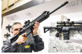
शामिल होंगी। SIG-716 राइफल 7.62x51mm कैलिबर गन होती है, जिनकी मारने की क्षमता 500

नई दिल्ली, (एजेंसी) भारतीय सेना के हथियारों में भारी इजाफा होने जा रहा है। खबरें हैं कि अमेरिका के साथ 70 हजार से ज्यादा बंदूकों की एक डील हुई है। बीते साल दिसंबर में ही रक्षा मंत्री राजनाथ सिंह की अगुवाई वाली काउंसिल ने इन बंदूकों की खरीद पर मुहर लगा दी थी। खास बात है कि यह खरीद ऐसे समय पर होने जा रही है, जब सीमा पर चीन और पाकिस्तान के साथ भारत के रिश्ते तल्ह बने हुए हैं।