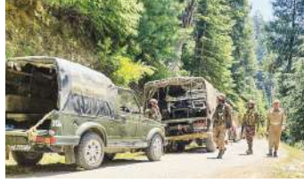
दौरान माछिल सेक्टर में भी एक ऑपरेशन चलाया गया। 57 राष्ट्रीय राइफल (आरआर) के सैनिकों ने इलाके में दो से तीन आतंकवादियों को देखा था। इसके अलावा,

जम्मू (एजेंसी) जम्मू-कश्मीर में आतंकवादियों की बढ़ती चुनौती के बीच सुरक्षाबलों ने बुधवार को बड़ी कार्रवाई की है। कुपवाड़ा जिले में दो अलग-अलग मुठभेड़ों में कम से कम तीन आतंकवादी मारे गए हैं। भारतीय सेना की चिनार कोर ने इसकी जानकारी दी है। उनके मुताबिक, कुपवाड़ा के माछिल सेक्टर में हुई मुठभेड़ में सुरक्षाबलों ने दो आतंकवादियों को मार गिराया। वहीं, कुपवाड़ा के ही तंगधार सेक्टर में एक अन्य आतंकवादी को मार गिराया गया।