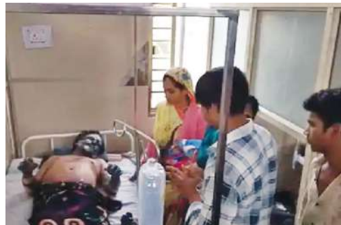
ये मजदूर झुलसे

जानकारी के अनुसार हादसा गुरुवार व शुक्रवार की दरमियानी रात 3 से 4 बजे के बीच हुआ। बताया जाता है कि औद्योगिक क्षेत्र में स्थित मालवा ऑक्सीजन प्लांट के प्रोडक्शन यूनिट में चार कर्मचारी केमिकल मिलाने का काम कर रहे थे।