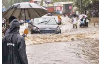
सौराष्ट्र और कच्छ के ऊपर बना गहरा दबाव क्षेत्र पश्चिम-दक्षिणपश्चिम की ओर बढ़ने तथा कच्छ और

नई दिल्ली, (एजेंसी) बाढ़ और बारिश से जूझ रहे गुजरात पर अब चक्रवात असना का खतरा मंडरा रहा है। अगस्त महीने में एक दुर्लभ मौसम संबंधी घटना के तहत गुजरात के सौराष्ट्र-कच्छ क्षेत्र में शुक्रवार को अरब सागर में चक्रवात के बनने और ओमान तट की ओर बढ़ने का अनुमान है। कच्छ और सौराष्ट्र में भारी बारिश की आशंका है। इन क्षेत्रों को रेड अलर्ट पर रखा गया है। साथ ही मछुआरों को अगले कुछ दिनों तक समुद्र में न जाने की सलाह दी गई है। गुजरात और उत्तरी महाराष्ट्र के तटों के साथ-साथ समुद्री क्षेत्रों में अगले दो दिनों तक 60-65 किमी प्रति घंटे की तेज हवाएं चल सकती हैं। मौसम विज्ञान विभाग (आईएमडी) ने कहा कि