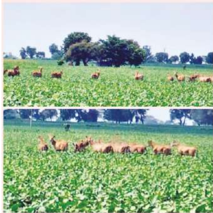
तक से हाथ धोना पड़ गया, हमारा है क्या टेबल पर कागजी कार्यवाही जिम्मेदार पदों पर अफसरों से प्रश्न से निराकरण हो जायेगा या इनके

देपालपुर। गौतमपुरा देपालपुर क्षेत्र में सोयाबीन फसल फल के दौर से गुजर रही है, और ऊपर से घोड़ा रोज, नीलगाय के झुंड पचास, से अधिक एक साथ अग्र खेत से निकल जाय तो फसल चौपट हो जाती है इन दिनों रुणजी छड़ोदा, बड़ोली, तलावली, और बहुत से आसपास के गावों में ये झुंड देखे जा सकते हैं, आगे किसान संगठन और किसानों ने मिल कर प्रसासन और सरकारी खेमे को कई जापन भी दिये, परन्तु समस्याओं का कोई धरातलीय निराकरण नहीं हुआ, इनको जंगलो में छोड़ने के वादे भी हुए परन्तु विभाग ने कोई ठोस कदम नहीं उठाये, कई किसानों ने कहा की इनकी वजह से रोड क्रॉस करने में कई किसानों ने अपनी जान