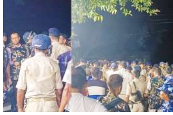
हमला कर दिया। इसी दौरान भगड़ होने लगी। पुलिस पर हमले में दो पुलिस कर्मियों समेत कई लोग घायल हुए हैं।

घटना के संबंध में लोगों का कहना है कि बड़का टोला के अखाड़ा के लोग निर्धारित रूट से हटकर दूसरे रूट से जाने की जिद करने लगे। जब प्रशासन ने इसकी इजाजत नहीं दी तो अखाड़ा नहीं निकालने की बात कहकर लौटने लगे। और फिर कुछ ही देर में अखाड़ा के लोगों ने सड़क जाम कर दिया। सड़क जाम होने पर जब प्रशासन वहां समझाने पहुंची तो उसमें शामिल उपद्रवियों ने पुलिस पर