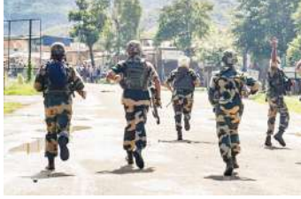
शांतिपुर इलाकों के लोग दहशत में हैं। हालात को देखते हुए सुरक्षाबल हार्ड अलर्ट पर हैं। बिष्णुपुर जिले में

हाल ही में इंफाल वेस्ट जिले में दो जगहों पर ड्रोन और बम से हमला किया गया। ड्रॉन्स देखे जाने के बाद से मणिपुर के बिष्णुपुर जिले के नारायणसेना, नाम्बोल कामोंग और इंफाल ईस्ट जिले के पुखाओ, दोलाईथाबी,