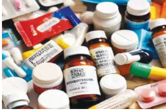
बैक्टीरियल संक्रमण के इलाज के लिए दी जाने वाली एंटीबायोटिक दवाएं शामिल थीं। रिपोर्ट के अनुसार, इन

नई दिल्ली। भारत के ड्रग नियामक, CDSCO द्वारा अगस्त में किए गए क्वालिटी टेस्ट में मधुमेह, उच्च रक्तचाप, विटामिन, कैल्शियम डी3 सप्लीमेंट्स, बच्चों में बैक्टीरियल संक्रमण, एसिड रिफ्लक्स और पेट संक्रमण की कई दवाएं क्वालिटी टेस्ट में खरी नहीं उतरीं हैं। भारत के सेंट्रल ड्रग्स स्टैंडर्ड कंट्रोल ऑर्गेनाइजेशन (CDSCO) ने अगस्त 2024 में एक विस्तृत रिपोर्ट जारी की थी। इस रिपोर्ट में देशभर में आमतौर पर उपयोग की जाने वाली कई महत्वपूर्ण दवाएं गुणवत्ता परीक्षण (क्वालिटी टेस्ट) में फेल पाई गईं। इन दवाओं में मधुमेह, उच्च रक्तचाप, एसिड रिफ्लक्स, विटामिन और कैल्शियम सप्लीमेंट्स, साथ ही बच्चों के लिए