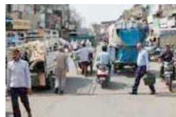
जनता के स्वास्थ्य के साथ शहर के कारोबार की साख बचाने के लिए हम यह कदम उठा रहे हैं। बीते साल भी एसोसिएशन ने ऐसा ऐलान किया था।