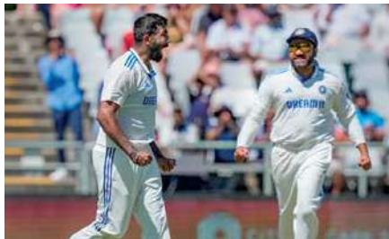
गए। उनके खाले में 869 अंक हैं।

नई दिल्ली। भारत के तेज गेंदबाज जसप्रीत बुमराह बुधवार को दुनिया के शीर्ष तेज गेंदबाज बन गए। उन्होंने रविचंद्रन अश्विन को पीछे छोड़ दिया। दिग्गज गेंदबाज ने हाल ही में बांग्लादेश के खिलाफ खेली गई दो मैचों की टेस्ट सीरीज में अपने सनसनीखेज प्रदर्शन के दम पर आईसीसी की ताजा टेस्ट रैंकिंग में शीर्ष स्थान हासिल किया। वहीं, युवा बल्लेबाज यशस्वी जायसवाल और दिग्गज बल्लेबाज विराट कोहली को भी टेस्ट रैंकिंग में फायदा हुआ है।