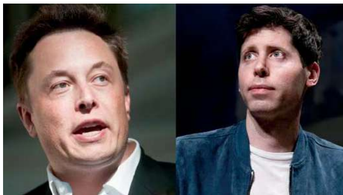
Ilya Sutskever's new company, Safe Superintelligence (SSI), is also on the

The list of companies includes rivals developing large language models such as Anthropic and Elon Musk's xAI. OpenAI's co-founder