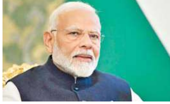
भवन की आधारशिला भी रखेंगे। पीएमओ ने कहा कि सभी के लिए सस्ती और सुलभ स्वास्थ्य देखभाल सुविधा सुनिश्चित करने की अपनी प्रतिबद्धता के तहत

मुंबई, (एजेंसी) प्रधानमंत्री नरेंद्र मोदी बुधवार को वीडियो कॉन्फ्रेंस के जरिए महाराष्ट्र में 7,600 करोड़ की विभिन्न विकास परियोजनाओं की आधारशिला रखेंगे। इसमें नागपुर में करीब 7,000 करोड़ की डॉ. बाबासाहेब आंबेडकर हवाईअड्डे के उन्नयन की आधारशिला भी रखेंगे।