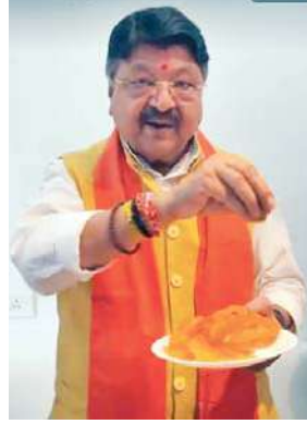
कर दिया है, अब इन परिणामों को महाराष्ट्र और झारखंड भी रिपीट करेंगे।

उन्होंने कहा, विपक्ष के लोग कहते थे, किसान नाराज हैं, किसानों ने भाजपा को वोट दिया। वे कहते थे कि दलित भाई नाराज हैं, दलित भाइयों ने भी वोट दिया। युवा नाराज हैं, युवाओं ने भी भाजपा को वोट दिया। वे कहते थे महिलाएं नाराज हैं, महिलाओं ने भी भाजपा को वोट दिया है। मंत्री ने कहा, बताएं कौन नाराज है भारतीय जनता पार्टी और प्रधानमंत्री नरेंद्र मोदी से? मैं कहता हूँ, हरियाणा के चुनाव ने साबित