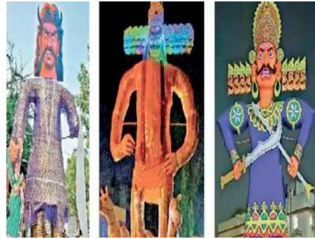
होगी। रावण दहन के पहले भव्य आतिशबाजी की जायेगी। रावण का दहन आटोमेटिक लेजर गन से किया जाएगा। जानकारी देते

रामबाग दशहरा उत्सव समिति का आयोजन इन्दौर शहर के प्रमुख आयोजनों में एक है। रावण की आंखें गिरगिट की तरह रंग बदलेगी। रावण को इको-फ्रेंडली मटेरियल से वाटरप्रूफ बनाया गया है। रावण दहन से पूर्व भैरव भवानी मन्दिर से भव्य शोभायात्रा निकाली जाएगी और यात्रा रावण दहन स्थान पर समाप्त